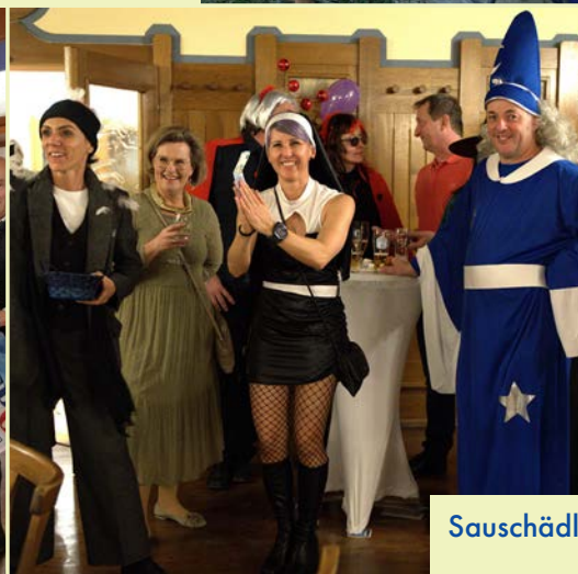
Sauschädl Musi 2024