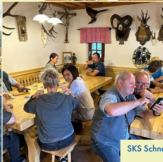
SKS Schnapsen 2023