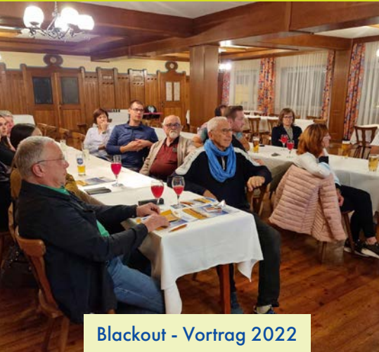
Blackout - Vortrag 2022