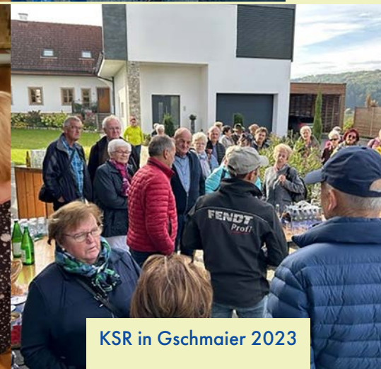
KSR in Gschmaier 2023