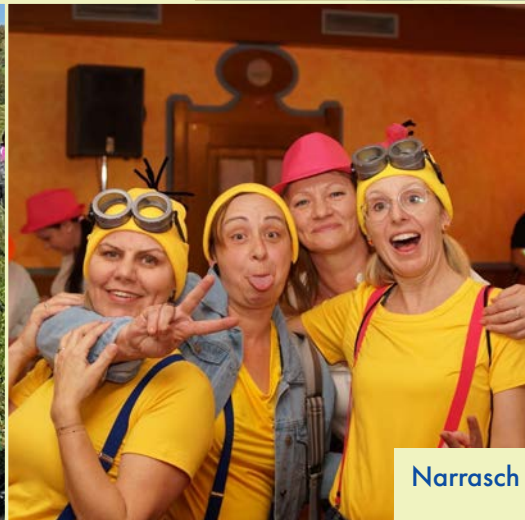
Narrasch Guat 2025