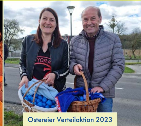
Ostereier Verteilaktion 2023